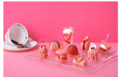
スイーツ イメージ

いちごのパウムクーヘンサンド いちごとトンカ豆のマカロン いちご最中 いちごと柑橘のクレープロール いちごとホワイトチョコレートのカヌレ いちごとライムのジュレ いちごモンブラン いちごスコーン いちごジャム クロテッドクリーム