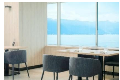
Grill & Dining G イメージ

※前日17時までの事前予約制となります。 ※表示料金は消費税・サービス料込みの料金です。 ※アフタヌーンティーは90分制となります。