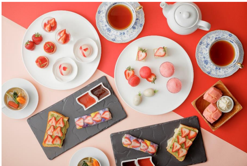
「“河西いちご園×琵琶湖マリオットホテル”Strawberry Afternoon Tea」イメージ

場所：レストラン「 グリル ダイニング Grill & Dining G」(12階)