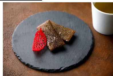
「ほうじ茶のフィナンシェ」イメージ

当アフタヌーンティーをお召し上がりいただいた後、琵琶湖が一望できるお部屋でのご滞在、さらにホテル併設のプラネタリウムで星空の世界をお楽しみいただける宿泊プラン。お部屋では紅葉に染まる山々とともに琵琶湖を眺めながらお召し上がりいただく「ほうじ茶のフィナンシェ」をご用意いたします。口いっぱいにはほうじ茶の風味が広がる小菓子と近江茶でゆったりとした時間をお過ごしください。