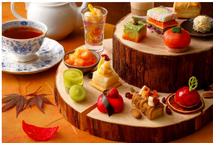
「Autumn Afternoon Tea」イメージ

琵琶湖マリオットホテル（滋賀県守山市今浜町、総支配人：佐々木一郎）では、2023年9月1日(金)～11月30日(木)の期間、ホテル12階のレストラン「 グリル ダイニングジ Grill & Dining G」にて、実りの秋にふさわしい季節の地元素材をふんだんに取り入れ、滋賀県の秋をイメージしたアフタヌーンティー「 オータムアフタヌーンティー Autumn Afternoon Tea」を発売いたします。