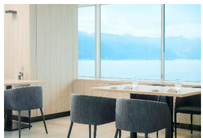
レストランイメージ