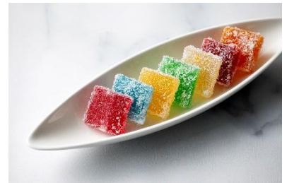
「レインボーパードフリュイ」イメージ