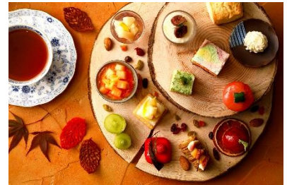
「Autumn Afternoon Tea」イメージ