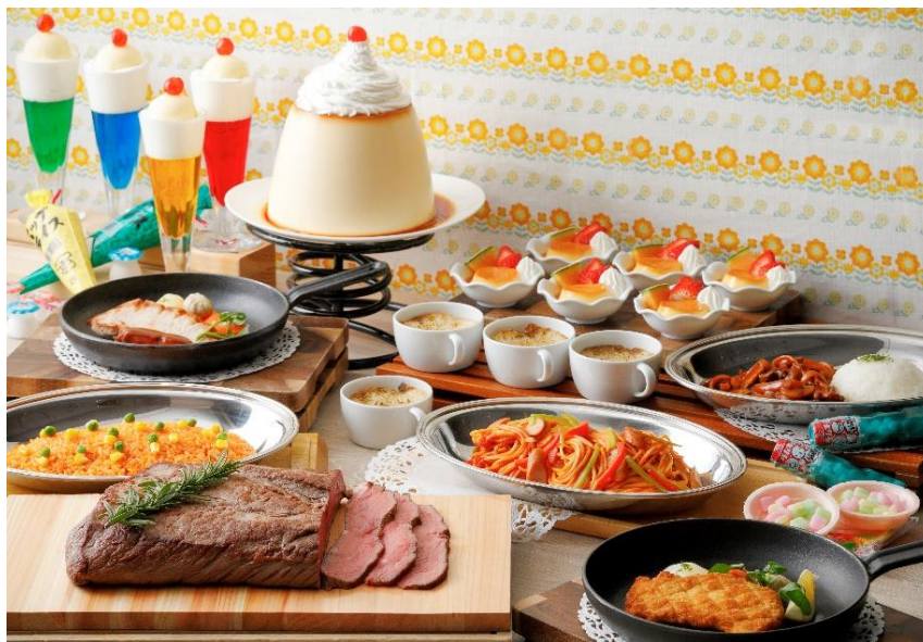
「Nostalgic Family Buffet」イメージ