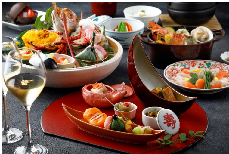
開運ディナーイメージ

ホテル周辺のパワースポットもご紹介 期間：2023年1月9日(月)～3月20日(月)