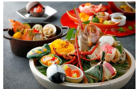
開運ディナー イメージ