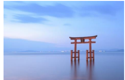
白髭神社

琵琶湖の中に朱塗りの大鳥居があり、国道 161 号線を挟んで社殿が立ちます。「白鬚さん」「明神さん」の名で広く親しまれ、「近江の巖島（いつくしま）」とも呼ばれています。社名のとおり、延命長寿・長生きの神様として知られ、縁結び・子授け・開運招福・学業成就・交通安全・航海安全など、人の営みごと、業ごとすべての導きの神でもあります。