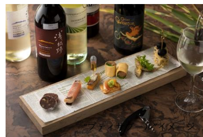
“プティサブール”イメージ