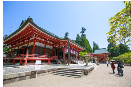
比叡山延暦寺 大講堂