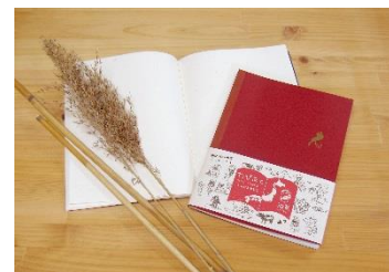
「ヨシ」と「たびあと」ノートイメージ

滋賀県にノート工場を構えるコクヨ工業滋賀が展開する「びわこ文具」は、琵琶湖のシルエットをモチーフとして取り入れた、お土産でも人気の高いシリーズです。本プランで特典として提供する「たびあと」ノートは、紙に琵琶湖の環境を守る植物「ヨシ」を使用し、風合いのある紙質、色合いで御朱印やサインが映える仕様です。